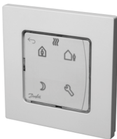
Danfoss Icon™ Programmable

Комнатный термостат типа Icon™ Programmable применяется для управления системой водяных теплых полов. Обеспечивает регулирование комнатной температуры в соответствии с потребностями пользователя, энергосбережение и комфорт.