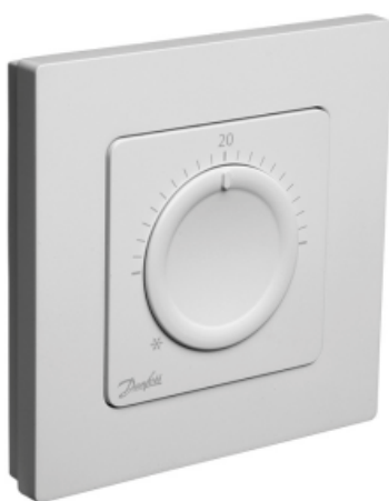
Danfoss Icon™ Dial

Комнатный термостат типа Icon™ Dial применяется для управления системой водяных теплых полов. Обеспечивает регулирование комнатной температуры в соответствии с потребностями пользователя, энергосбережение и комфорт.