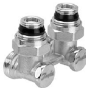
RLV-KS угловой с присоединением к отопительному прибору G ½ и G ¾