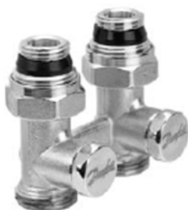
RLV-KS прямой с присоединением к отопительному прибору G ½ и G ¾