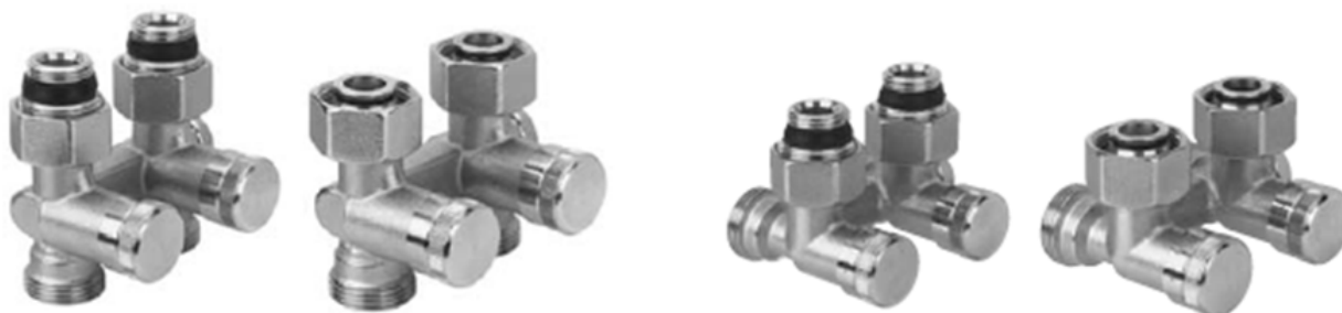
RLV-K прямой с присоединением к отопительному прибору G ½ и G ¾