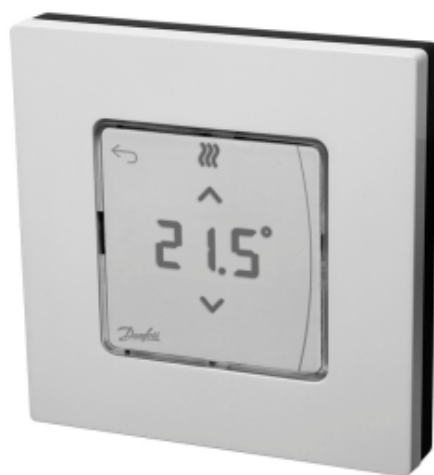
Danfoss Icon™ Display

Комнатный термостат типа Icon™ Display применяется для управления системой водяных теплых полов. Обеспечивает регулирование комнатной температуры в соответствии с потребностями пользователя, энергосбережение и комфорт.