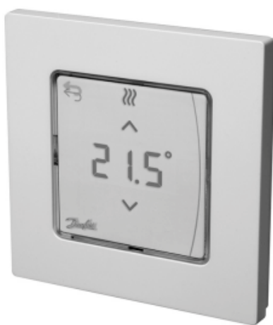
Danfoss Icon™ Display

Комнатный термостат типа Icon™ Display применяется для управления системой водяных теплых полов. Обеспечивает регулирование комнатной температуры в соответствии с потребностями пользователя, энергосбережение и комфорт.