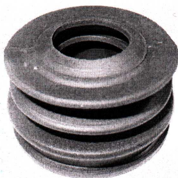
Манжета переходная D 50x25 трех лепестковая

АДРЕС: 140054, Московская обл, гор. Котельники, мкр. Ковровый, дом 16, кв. 1 Тел/факс 8 (49243) 4-25-82.