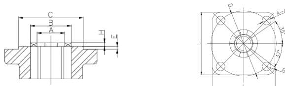
Рис. 2. Фланец шиберной задвижки под электропривод.

*Крутящий момент указан с учетом коэффициента безопасности для защиты от перегрузки в разных условиях эксплуатации, в т.ч. в аварийных ситуациях, а также для продления срока службы задвижки