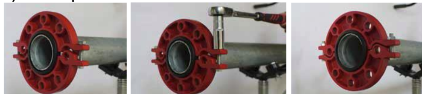
Рис. 1. Монтаж накидного разъемного фланца «LEDE».