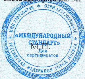
Схема сертификации: Зс.