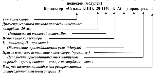
Схема условных обозначений при заказе конвекторов с различными вариантами узлов

5.3 Условное обозначение при заказе конвекторов с учетом п.5.2 приведено на схеме и включает: