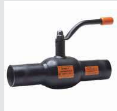
КШТ Серия 12, DN 15–50, PN 4,0 МПа Сварка / Сварка