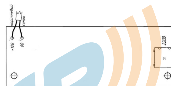
Рис. 8.2 Схема клеммников встроенного источника питания

Подключение внешнего питания 220 В (только для исполнения, содержащего источник питания) осуществляется в соответствии со схемой рисунка 8.2.