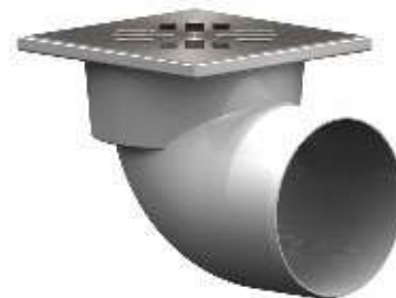
Табл. 6 Технические данные трапов типа ТП-105.110

ТП-105.110-150HSHs Трап горизонтальный D110 решетка нерж. сталь, 150x150 Максимальная нагрузка до 300 кг ТП-105.110-150HPHs Трап горизонтальный D110 с чугунной решеткой 150x150 Максимальная нагрузка до 1,5 тонн ТП-105.110-150HSDs Трап горизонтальный D110 решетка нерж. сталь, 150x150. «Сухой» затвор. Максимальная нагрузка до 300 кг ТП-105.110-150HPDs Трап горизонтальный D110 с чугунной решеткой 150x150. «Сухой» затвор. Максимальная нагрузка до 1,5 тонн