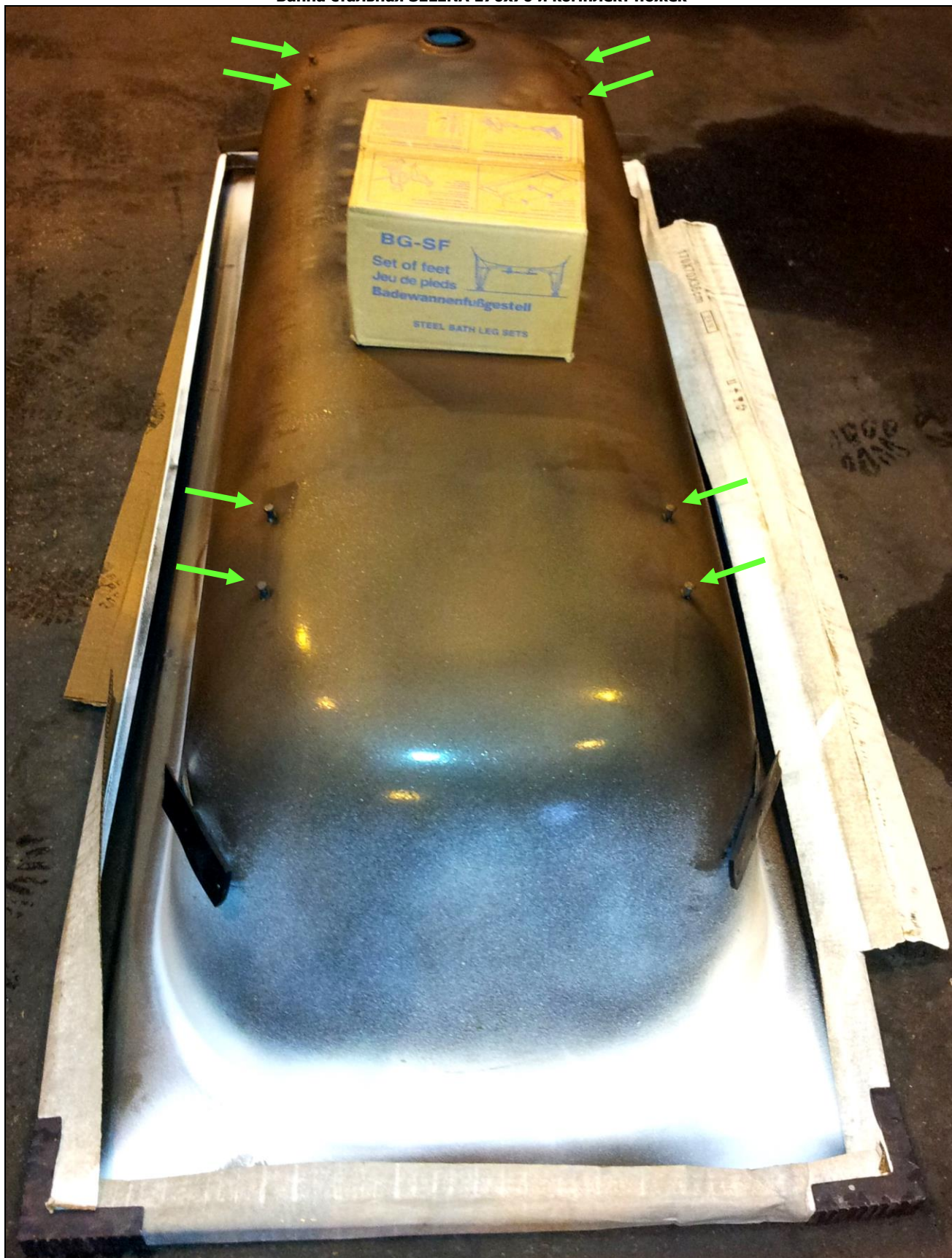
Ванна стальная SELENA 170x70 и комплект ножек