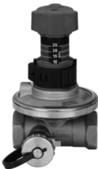
АРТ DN 15-50