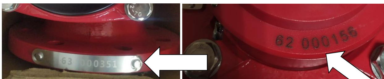
Рисунок 3 – Место нанесения заводского номера